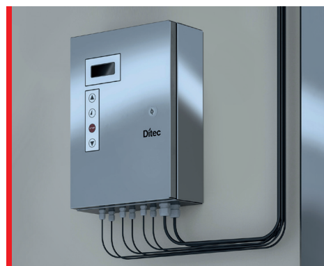
Lcd-scherm met 32 karakters